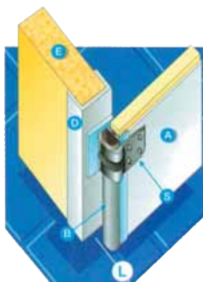
Rám „C“ z hliníka