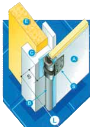
Rám opláštený ocelový